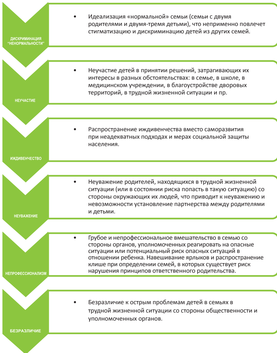
Рисунок 2. Риски в процессе содействия ответственному родительству